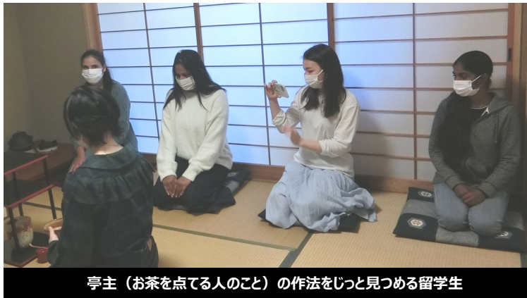
亭主（お茶を点てる人のこと）の作法をじっと見つめる留学生

茶道についての知識を持っている留学生も、実際に茶席に招かれるのは初めてで、まず、お茶碗の扱いやお抹茶の頂き方を教わりました。いよいよお点前が始まると、緊張もあってか静寂が訪れました。