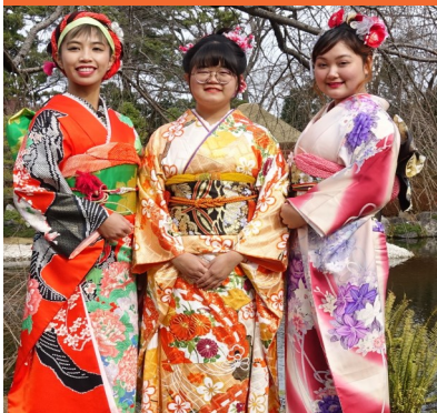
静岡市駿府公園紅葉山庭園