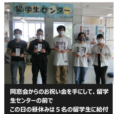
同窓会からのお祝い金を手にして、留学生センターの前でこの日の昼休みは5名の留学生に給付

本学の留学生では全体で10名がN1に合格し、この支援を受けることができました。なお、12月の試験の結果は2022年2月時点で7人の合格の報告があり、このあとに申請となります。