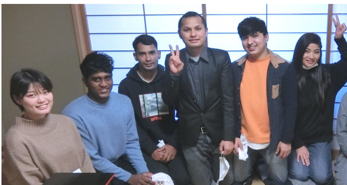
留学生センター学生スタッフ代表（左）と、2日目に参加した留学生

お点前が終わると、緊張がほぐれた様子で笑顔が見られました。ただ、頑張っていた正座も限界を迎えており、すぐに立ちあがるのが厳しいようでした。留学生の貴重な体験に、全面的にご協力いただいた茶道サークルの皆さん、ありがとうございました。