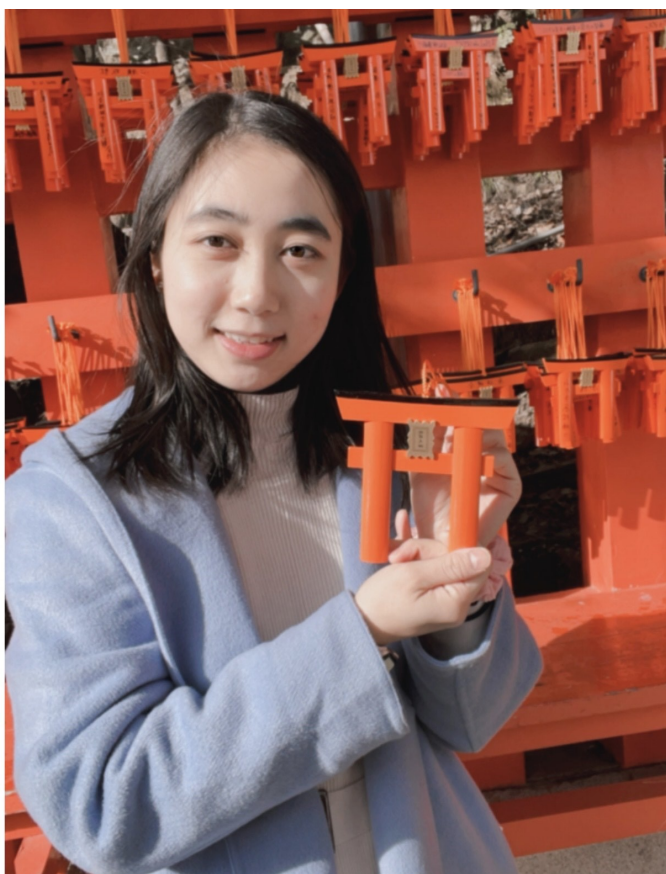
“千本鳥居”で有名な「伏見稲荷大社」で記念の1枚