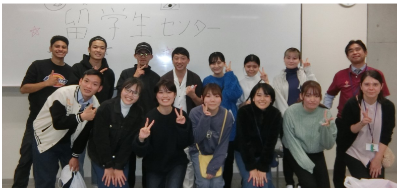
達成感いっぱいの笑顔を見せる 学生スタッフのみなさん