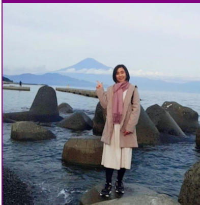
静岡市清水区にある三保の松原