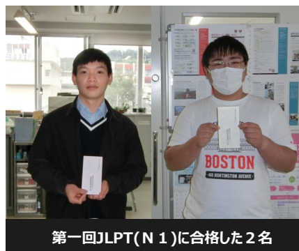
第一回JLPT(N1)に合格した2名

なお、第二回目の日本語能力試験は2022年12月4日(日)に実施され、合格者は8名と奮闘しました。