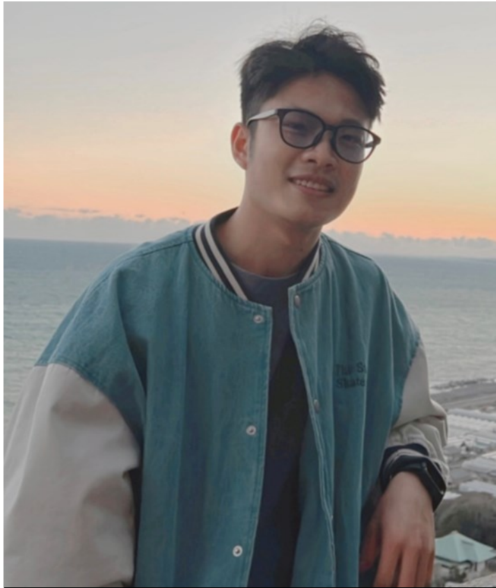
久能山東照宮で撮影した夕焼けは、お気に入りの1枚

富士山の美しい自然景観は一度見ておく価値があります。また、富士登山は自らの体力や精神力を試す場でもあり、得難い経験ができました。