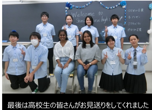
最後は高校生の皆さんがお見送りをしてくれました