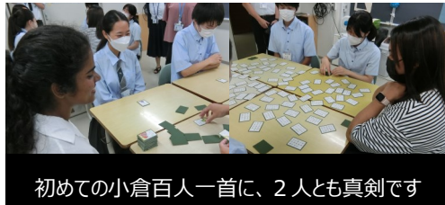
初めての小倉百人一首に、2人も真剣です