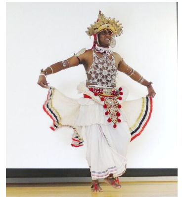
衣装はなんと、5kgもあります

その他、ベトナム・中国・スリランカの留学生による母国紹介や、椅子取りゲーム、フリートークを行いました。本学卒業生やこども園の子どもたち、近隣住民の皆さんも遊びに来てくれ、大変賑やかなフェアを開催することができました。