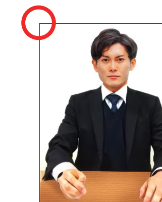
受験者の顔、手元の両方が映っている