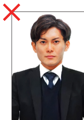
受験者の顔しか映っていないのはNG