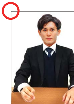
受験者の顔、手元の両方が映っている