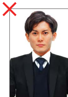
受験者の顔しか映っていないのはNG